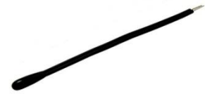
Figura 1: 9900015