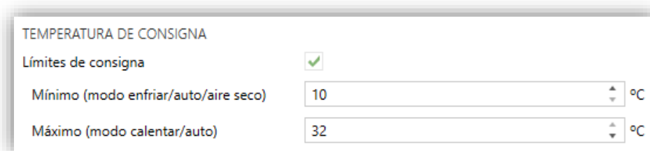
Figura 7. Pasarela AA. Configuración. Temperatura de consigna.

Una vez habilitados, se dispondrá de varios objetos para poder modificar en tiempo de ejecución dichos límites. Los valores de dichos objetos estarán restringidos al intervalo definido por los límites absolutos establecidos por la propia máquina (10°C y 32°C):